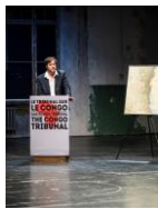
31 – Milo Rau bei seiner Eröffnungsrede zu den "Berlin Hearings". / Milo Rau delivers his opening remarks during „The Berlin Hearings“.